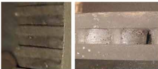
26 meses/75,130 km CON protección Webb LifeShield™