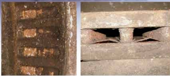
26 meses/52,768 km SIN protección Webb LifeShield™

Pruebas realizadas durante dos inviernos en la región Salt Belt en Estados Unidos